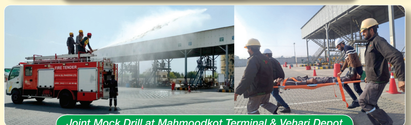
Joint Mock Drill at Mahmoodkot Terminal & Vehari Depot