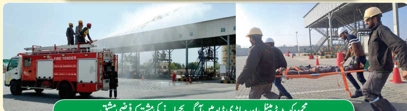
محمود کوٹ ٹرینٹل اور وہاری ڈپو میں آگ بجھانے کی مشق فرضی مشق