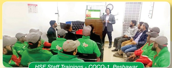
HSE Staff Trainings - COCO-1, Peshawar

At COCO-1, Peshawar , the training was focused on: