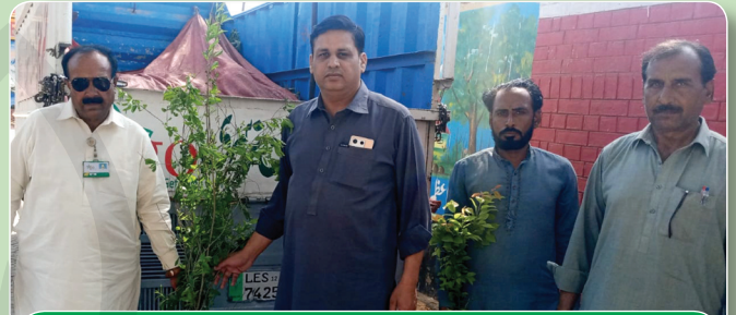
Government Boys High School Khatkhana, Haroonabad