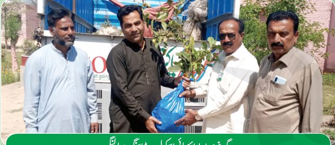
گورنمنٹ پوائنٹ ہائی اسکول روڈ اسکھ، بہاولنگر