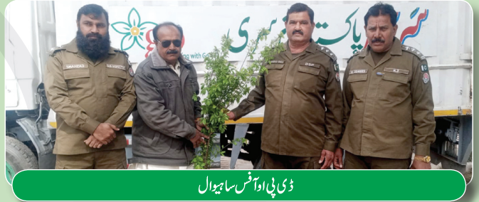
ڈی بی اوفس ساہیوال