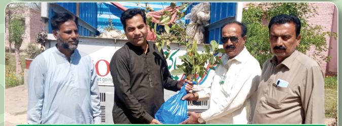
Government Boys High School Roda Singh, Bahawalnagar