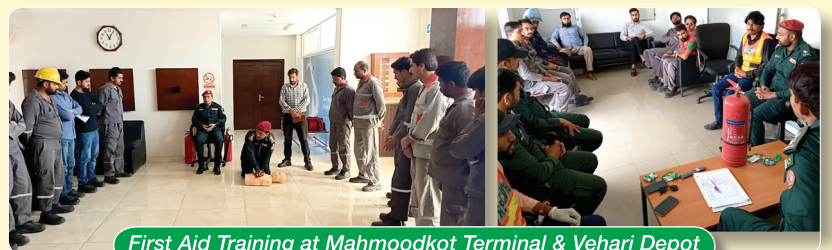
First Aid Training at Mahmoodkot Terminal & Vehari Depot

go conducted external training sessions and mock fire drills with local Civil Defense and Rescue 1122 departments at Mahmoodkot Terminal and Vehari Depot.