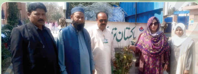
Government Degree College for Girls Sahiwal