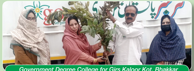
Government Degree College for Girls Kaloor Kot, Bhakkar

Tree Plantation for the Spring Season 2024 was carried out with full devotion under the auspices of 'GO Nursery' from February to March 2024. This time, 300,000 saplings were prepared at the nursery for the spring season and have been distributed amongst various educational institutions, governmental and non-governmental setups, and other societal bodies. The saplings mostly comprise shady trees, fruit trees, and floral plants of various kinds. The sole aim of this noble initiative is to make Pakistan green and clean with a pollution-free environment for the people, especially our coming generations.