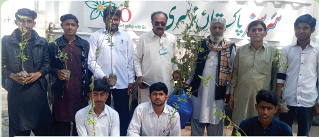
گورنمنٹ ہائی اسکول پل بگار، عبدالکیم، خانپوال