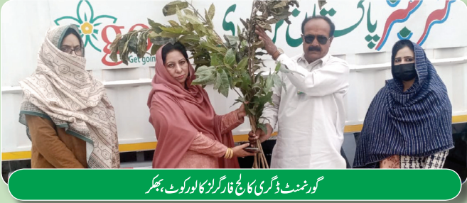
گورنمنٹ ڈگری کالج فار گرلز کالور کوٹ، بھکر

'go' نرسری کے تحت فروری اور مارچ 2024 تک موسم بہار سیزن 2024 کیلئے شجری کاری میں بھرپور طریقے سے کی گئی۔ اس بار موسم بہار کے سیزن کیلئے نرسری میں 300,000 پودے تیار کئے گئے جنہیں مختلف تعلیمی اداروں، سرکاری اور غیر سرکاری اداروں اور دیگر تنظیموں میں تقسیم کیا گیا۔ پودوں میں زیادہ گھنے چھاؤں دار درخت، پھلدار درخت اور مختلف انواع کے پھل دار درخت شامل ہیں۔ اس نیک اقدام کا واحد مقصد پاکستان کو سرسبز و شاداب بنانا ہے اور لوگوں، خصوصاً ہماری آنے والی نسلوں کو آلودگی سے پاک ماحول دینا ہے۔