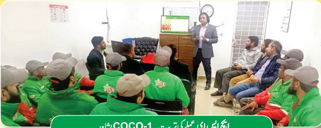
ایچ ایس ای عملی تربیت - COCO-1 پشاور