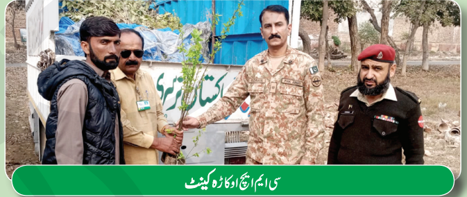
سی ایچ اڈاکاڑہ کینٹ