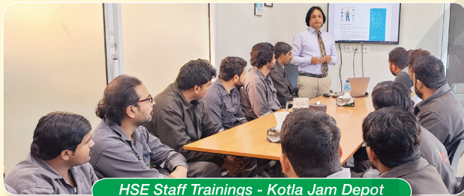
HSE Staff Trainings - Kotla Jam Depot