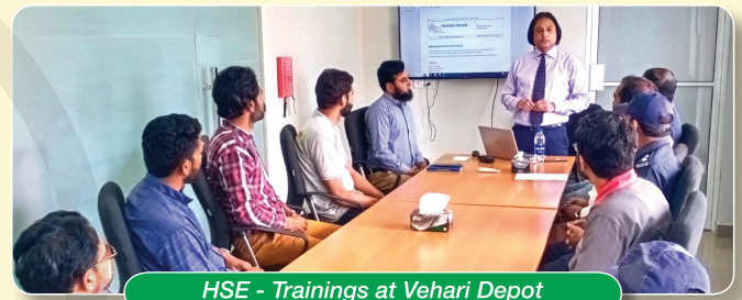
HSE - Trainings at Vehari Depot

At Vehari Depot , the training was focused on: