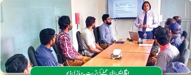
ایچ ایس ای عملی تربیت - وہاری ڈپو