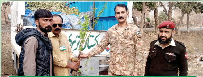
CMH Okara Cantt