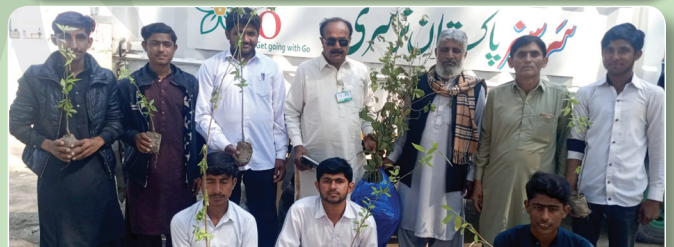
Government High School Pull Bagar, Abdul Hakeem, Khanewal