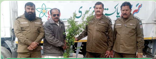
DPO Office Sahiwal