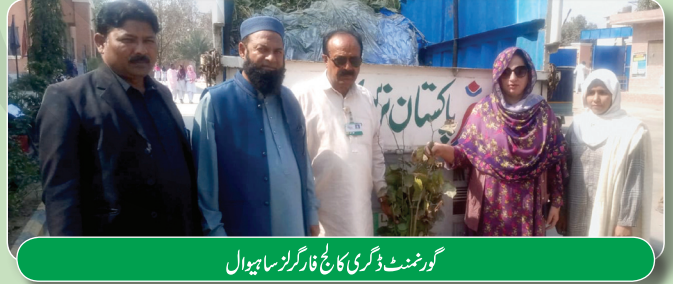
گورنمنٹ ڈگری کالج فار گرلز ساہیوال