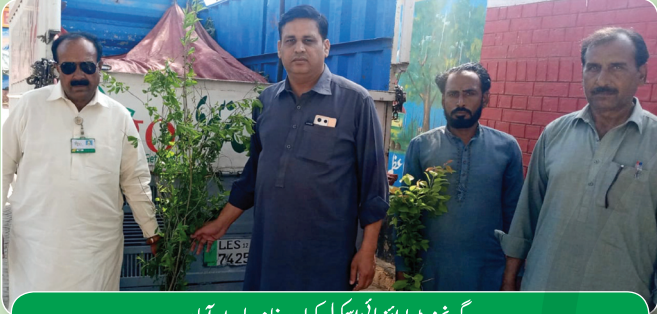
گورنمنٹ پوائنٹ ہائی اسکول کھات خانہ، ہارون آباد