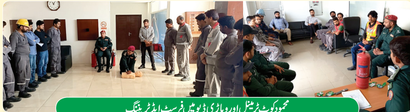
محمود کوٹ ٹرینٹل اور وہاری ڈپو میں فرسٹ ایڈ ٹریننگ

GO نے محمود کوٹ ٹرینٹل اور وہاری ڈپو میں مقامی سول ڈیفنس اور ریسکیو 1122 کے ساتھ مل کر بیرونی ٹریننگ سیشنز اور آگ بجھانے کی فرضی مشق کا انعقاد کیا۔