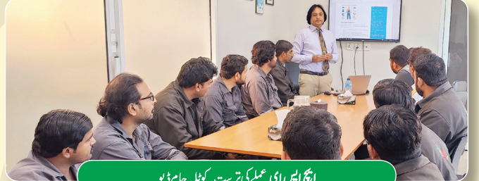
ایچ ایس ای عملے کی تربیت - کوئلہ جام ڈپو